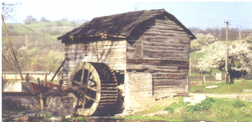
Фото 2. Водяная мельница в Барсуках