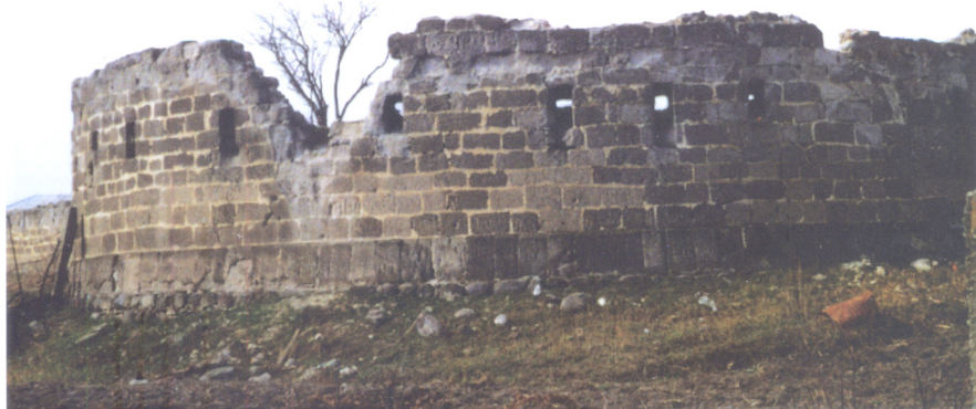
Фото 1. Юго-Восточный бастион Назрановской крепости

В рассказе описаны ориентиры, которые с точностью указывают на место, где молодой Пешков начал свою трудовую деятельность на территории Ингушетии. Рассказ начинается так: «В горном ущелье, над маленькой речкой-притоком Сунжи — выстроили рабочие барак». Маленькая речка это река Назранка. Исследователь культурного прошлого ингушей А. Н. Генко в начале XX века дал описание этой реки: «Назран (Nasiran) представляет собою маленькую реку, текущую к северо-востоку и окруженную болотистой почвой, тростником и кустарниками; она имеет чистую родниковую воду, но при болотистом дне, и потому непроходима нигде, где нет брода. Трудности переправы, возвышенности и сама Сунжа, протекающая в лежащих к востоку лесистых горах, образуют здесь крепкое дефиле...» [3, с. 457]. «На сажень ниже барака, — пишет М. Горький, — бежит